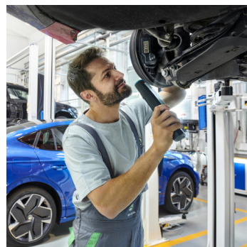
Škoda Premium Care 1