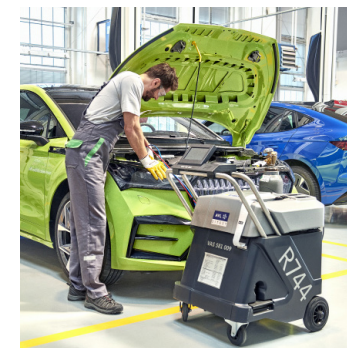
Škoda Premium Care Plus 2

Czas trwania w latach po upływie okresu 3-letniej gwarancji: