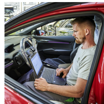
Škoda Premium Care Plus 2