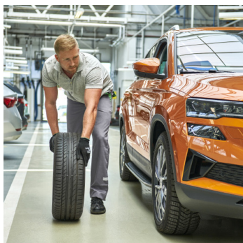
Škoda Premium Care 1

Škoda Premium Care to pakiet w ramach którego zyskujesz możliwość naprawy samochodu w przypadku awarii lub usterki części objętej umową, bez ponoszenia dodatkowych kosztów. Ponadto, w ramach pakietu Škoda Premium Care otrzymujesz opłacone przeglądy okresowe (robocizna, oryginalne części i materiały eksploatacyjne, zgodne z planem serwisowym).