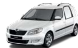
Biel Candy niemetalizowany