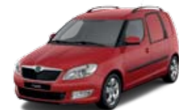
Czerwień Corrida niemetalizowany