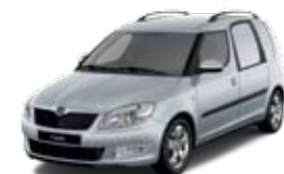
Srebrny Brilliant metalizowany