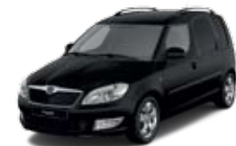
Czerń Magic perłowy