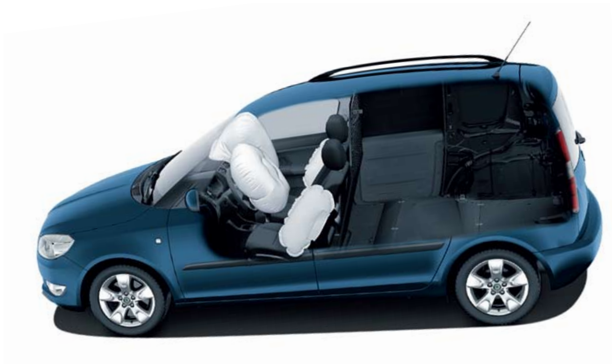
Blaszane wypełnienie okien drzwi tylnych w kolorze nadwozia.

W wersji podstawowej otrzymamy także elektrohydrauliczne wspomaganie układu kierowniczego oraz regulowaną w dwóch płaszczyznach kolumną kierownicy. Jako opcja dostępne są m.in. półautomatyczna klimatyzacja Climatic, systemy wspomagania jazdy ASR i ESP oraz relingi dachowe.