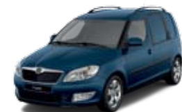
Błękit Pacific niemetalizowany