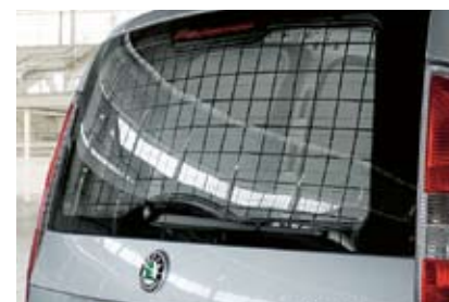
Metalowa kratka zabezpieczająca tylną szybę – funkcjonalne udogodnienie z listy wyposażenia opcjonalnego modelu Praktik.