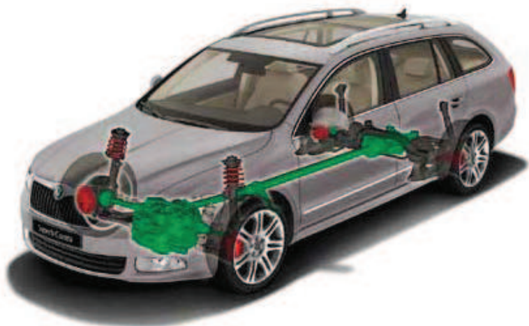
Škoda Superb Combi z napędem na cztery koła i sprzęgłem Haldex 4. generacji (silniki 1.8 TSI/118 kW, 3.6 FSI V6/191 kW, 2.0 TDI CR DPF/103 kW i 2.0 TDI CR DPF/125 kW)