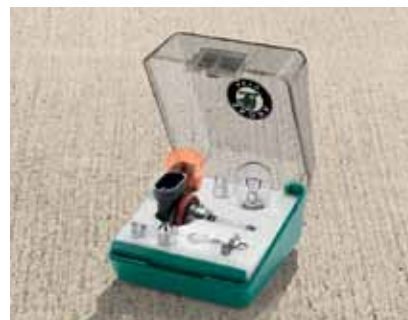
Komplet żarówek zapasowych , w zależności od rodzaju reflektorów dla ŠKODY Superb (BDB 800 001-2); dla ŠKODY Superb Combi (BDB 800 003-4)