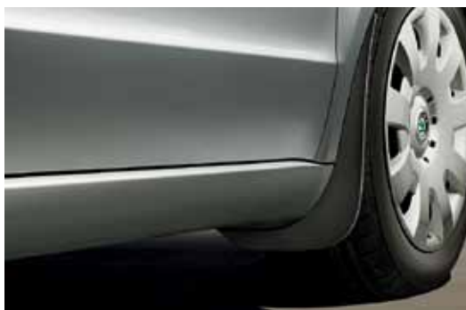
Przednie osłony przeciwbłotne (KEA 800 001)