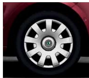
Kołpaki Rif do kół 7.0J x 16", 4 szt. (CDB 800 001)