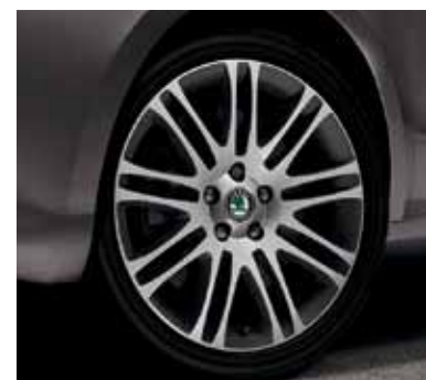
Obręcz koła ze stopów lekkich Luxon 7.5J x 18" – stylistyka w kolorze szary antracyt, do opony 225/40 R18 (CCX 800 004A)