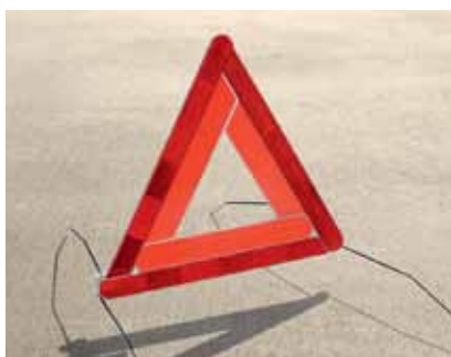
Trójkąt ostrzegawczy (GGA 700 001A)