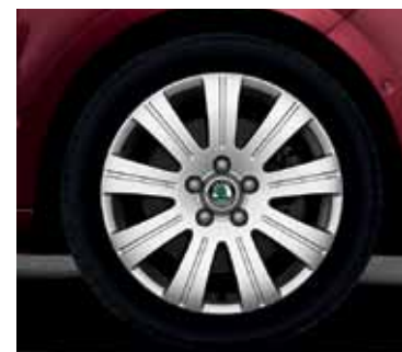
Obręcz koła ze stopów lekkich 6.0J x 17" Flash do opony 205/50 R17 (CCX 800 003) - dopasowane do łańcuchów śniegowych (CEP 800 001)