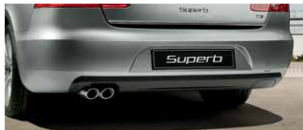
Dyfuzor (FAA 800 002) Ozdobna końcówka rury wydechowej dla silnika 1.4 TSI (FDC 610 001); dla silnika 1.9 TDI (FDC 620 001)