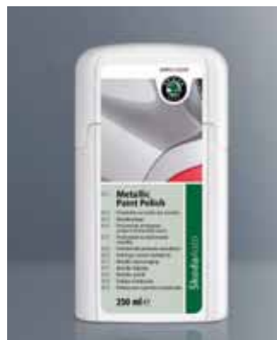
Środek do powierzchni metalizowanych. Pojemność 250 ml (HAO 096 008)