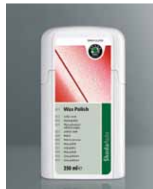
Wosk ochronno-nabłyszczający. Pojemność 250 ml (HAO 096 009)