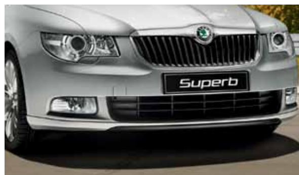
Spoiler zderzaka przedniego (FAA 800 003)