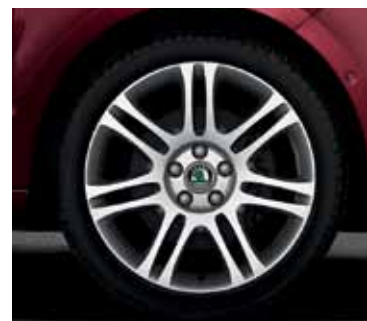
Obręcz koła ze stopów lekkich 7.5J x 18" Themisto do opony 225/40 R18 (CCH 800 001)