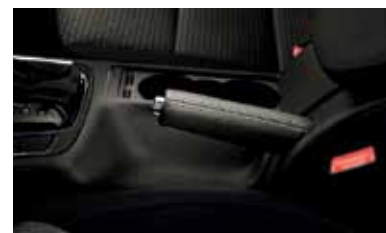
Skórzany uchwyt hamulca ręcznego (FFA 600 011)