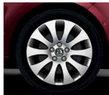
Obręcz koła ze stopów lekkich 7.0J x 17" Venus do opony 225/45 R17 (CCR 800 002)