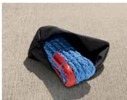
Linka holownicza (GAA 500 001)