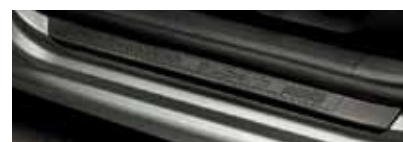
Listwy naprogowe w kolorze czarnym (KDA 800 001)