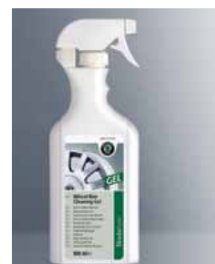
Żel do czyszczenia obręczy kół. Pojemność 500 ml (HBA 096 038)