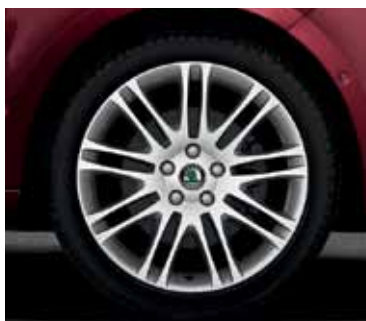
Obręcz koła ze stopów lekkich 7.5J x 18" Luxon do opony 225/40 R18 (CCX 800 004); stylistyka w kolorze szary antracyt (CCX 800 004A)