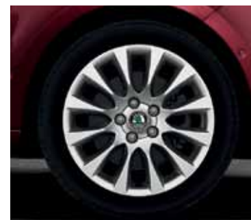
Obręcz koła ze stopów lekkich 7.5J x 17" Laurel do opony 225/45 R17 (CCX 800 002)