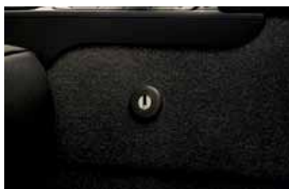
Mechaniczna blokada dźwigni zmiany biegów: przekładnia manualna (DVC 800 001)

Brak zdjęcia: przekładnia automatyczna (DVC 800 002 dla samochodów wyprodukowanych przed 45 tygodniem 2009 r.) (DVC 800 003 dla samochodów wyprodukowanych po 45 tygodniu 2009 r.)