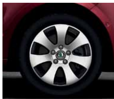
Obręcz koła ze stopów lekkich 7.0J x 16" Spectrum do opony 205/55 R16 (CCR 800 001)