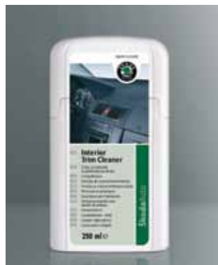
Emulsja do czyszczenia deski rozdzielczej. Pojemność 250 ml (HBA 096 040)