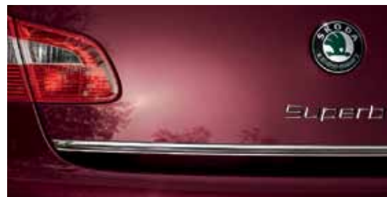
Chromowana listwa pokrywy bagażnika dla ŠKODY Superb (KDA 800 003)