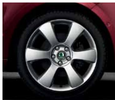
Obręcz koła ze stopów lekkich 7.5J x 18" Luna do opony 225/40 R18 (CCA 800 001)