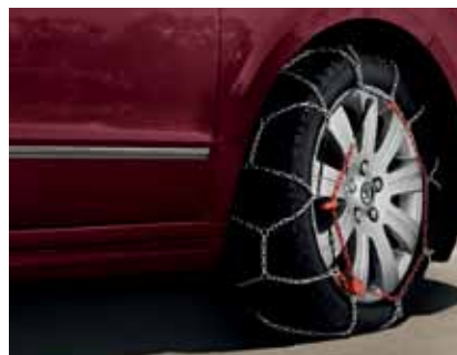
Łańcuchy śniegowe do opon 205/55 R16 lub 205/50 R17 (CEP 800 001); odpowiednie dla obręczy kół ze stopów lekkich 6.0J x 17" Flash (CCX 800 003)