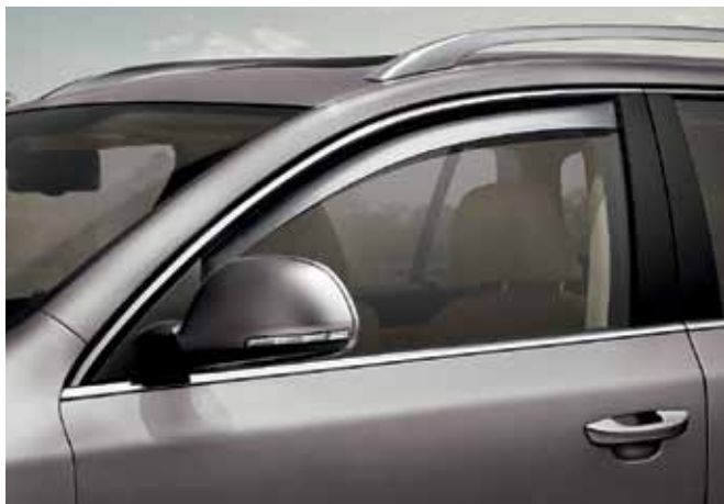
Owiewki szyb przednich (KCD 809 001)