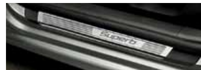
Ozdobne listwy naprogowe z elementami ze stali nierdzewnej (KDA 800 002)