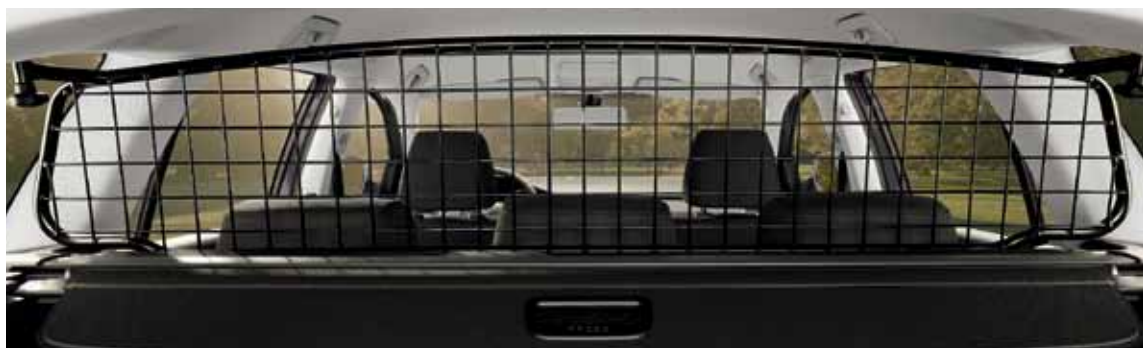
Kratka oddzielająca przestrzeń bagażową dla ŠKODY Superb Combi (3T9 071 195)