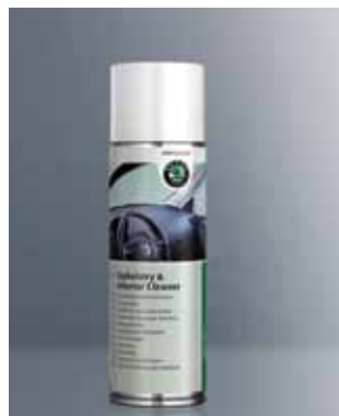
Środek do czyszczenia tapicerki i wnętrza. Pojemność 300 ml (HBA 096 024)