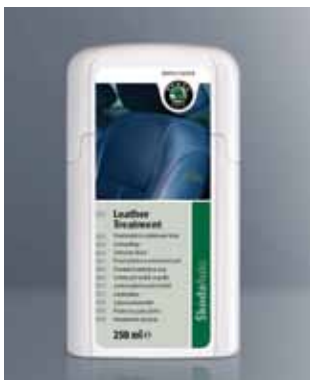
Emulsja do pielęgnacji skóry. Pojemność 250 ml (HBA 096 025)