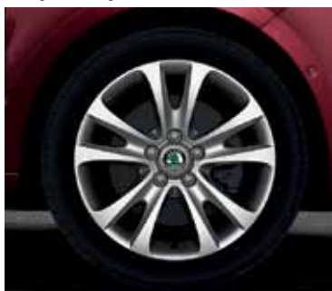
Obręcz koła ze stopów lekkich 7.5J x 17" Trifid do opony 225/45 R17 (CCR 800 004)