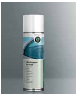
Odmrażacz do szyb. Pojemność 300 ml (HFA 096 020)