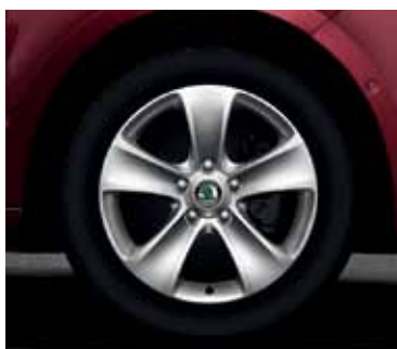
Obręcz koła ze stopów lekkich 7.0J x 16" Moon do opony 205/55 R16 (CCR 800 005)