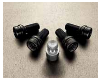
Komplet śrub zabezpieczających koła przed kradzieżą (CFA 071 004)