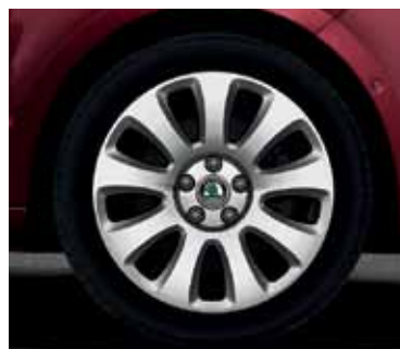
Obręcz koła ze stopów lekkich 7.5J x 17" Callisto do opony 225/45 R17 (CCR 800 003)