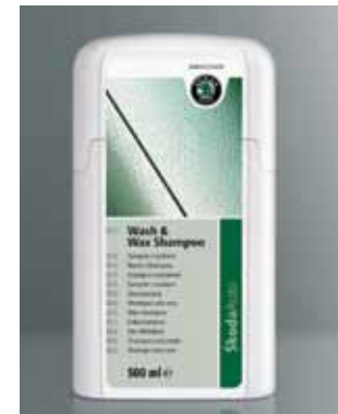
Szampon z woskiem. Pojemność 500 ml (HAO 096 007)