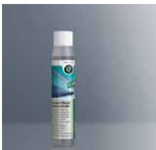
Letni płyn do spryskiwaczy – koncentrat 1:100. Pojemność 40 ml (HBA 096 039)