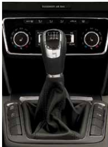
Skórzany uchwyt dźwigni zmiany biegów do przekładni manualnej, sześciostopniowej (FFA 800 002) Brak zdjęcia: pięciostopniowej (FFA 800 001)