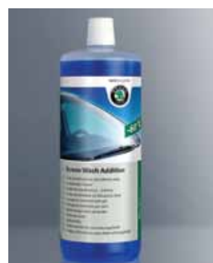
Zimowy płyn do spryskiwaczy. Pojemność 1000 ml (HFA 096 022)