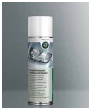
Środek do usuwania owadów i czyszczenia powierzchni szklanych. Pojemność 300 ml (HBA 096 028)