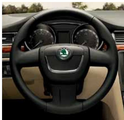
Skórzana kierownica, czteroramienna (FBA 800 000); trójramienna (FBA 800 001)